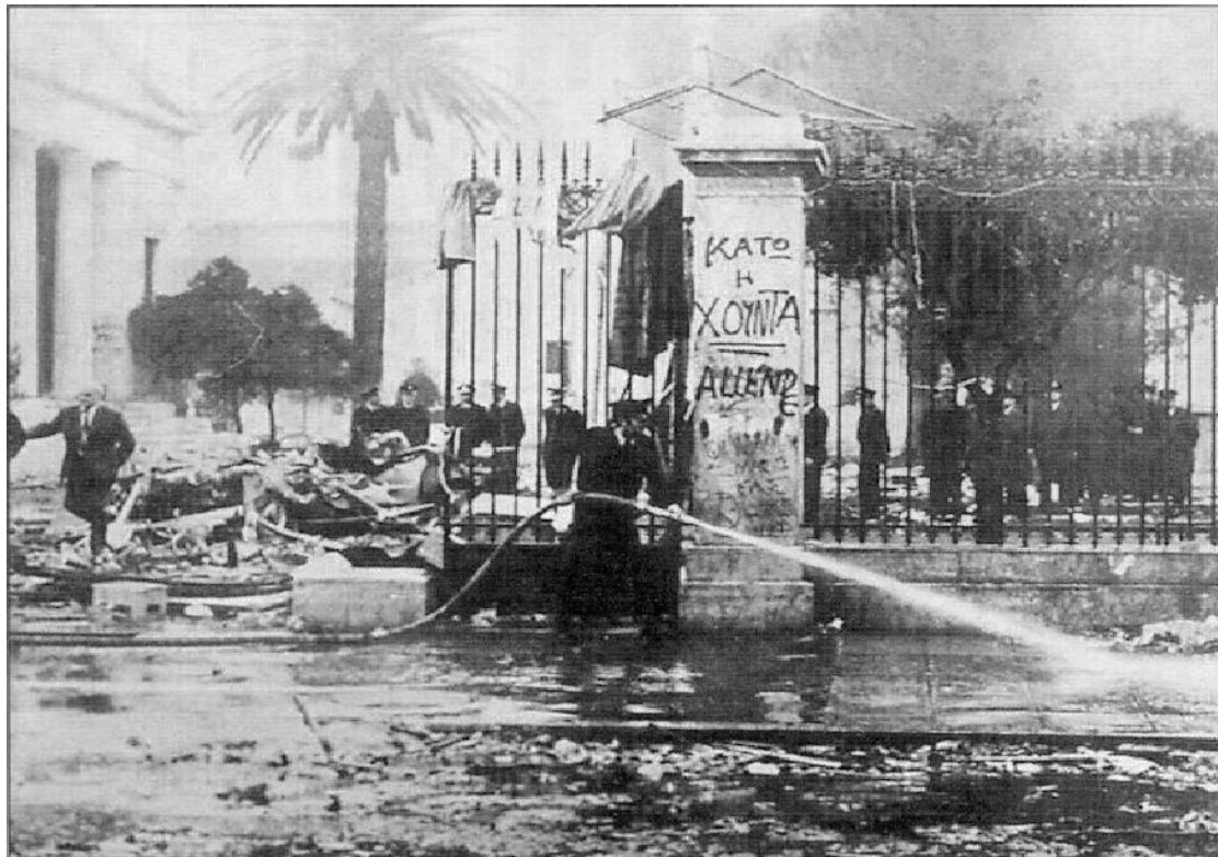
Η εικόνα της πύλης του Πολυτεχνείου το πρωί του Σαββάτου, λίγες ώρες μετά την καταστολή, και η πρώτη επιχείρηση εξάλειψης των ιχνών της βίαιης επέμβασης.